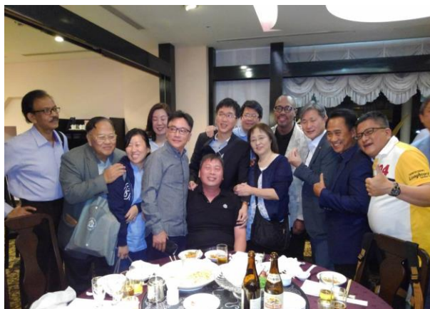
・アジアの各国の会長達と